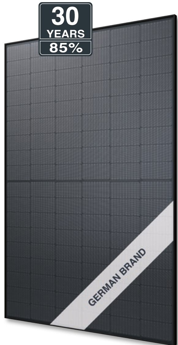
Abb. ähnlich 108MGDE230704A